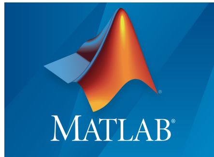
Slika 1: Logo programskog jezika MATLAB

Često za rešavanje težih računskih problema veliku pomoć nam može pružiti računar. MATLAB je izumeo Kliv Moler (engl. Cleve Moler ), šef katedre za informatiku Univerziteta "Novi Meksiko", kako bi omogućio studentima pristup bibliotekama LINPACK i EISPACK bez znanja Fortrana. Matlab se brzo proširio na druge univerzitete i dobio podršku ljudi koji se bave primenjenom matematikom. Inženjer Džek Litl (engl. Jack Little ) prilikom Molerove posete na Univerzitet "Stenford" uvideo je komercijalni potencijal MATLABa. On je sa Molnerom i Stivom Bangertom (engl. Steve Bangert ) preradio MATLAB u C programskom jeziku. Zajedno su 1984. godine osnovali kompaniju MathWorks[1]. Logo jezika MATLAB prikazan je na slici 1.